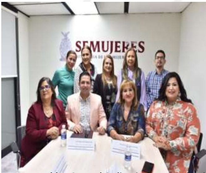
XXXIII Asamblea General Ordinaria de Asociados de la Red Mé: Participación del Director del Sistema Sinaloense de Radio y Televisión.

Fortalecer las acciones de transversalidad que abonen a la igualdad de género, promover un lenguaje incluyente y acciones afirmativas que visibilicen a las mujeres, así como a la comunidad LGBT, a la niñez y a las personas con discapacidad, fue el motivo de un Convenio de colaboración entre el Sistema Sinaloense de Radio y Televisión y la Secretaría de las Mujeres .