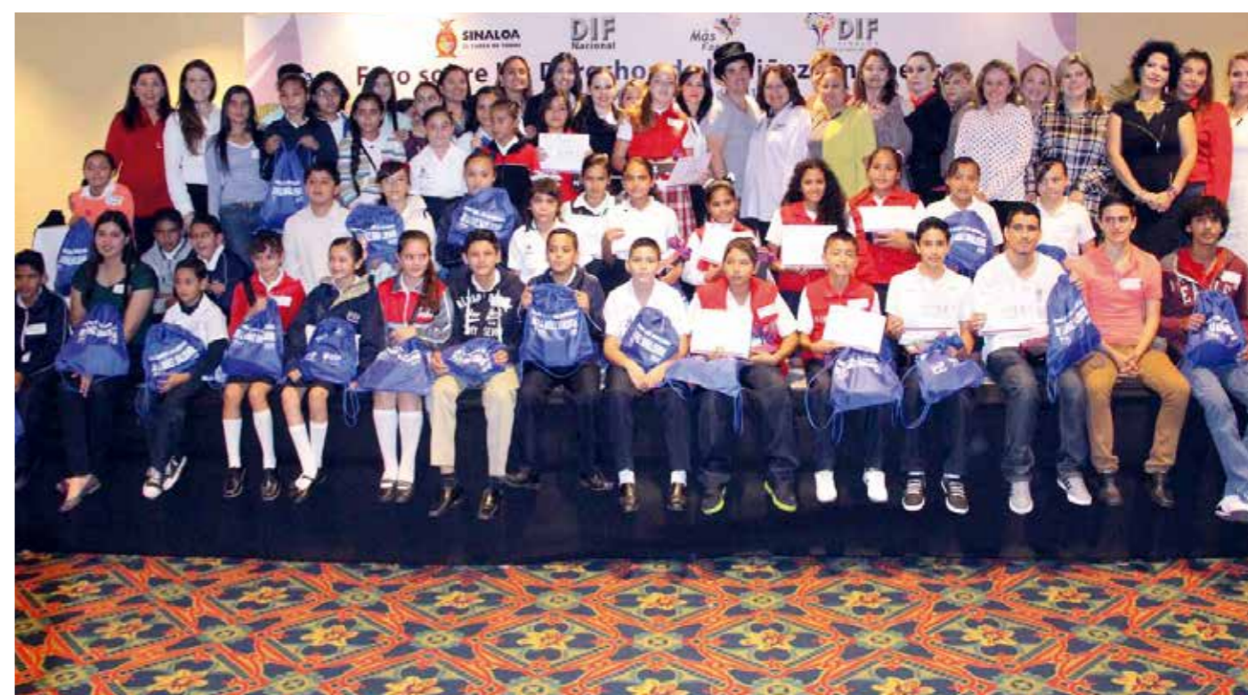
Foro sobre los Derechos de la Niñez Sinaloense

Con el objetivo de impulsar los derechos de la niñez sinaloense, el Sistema DIF Sinaloa a través de la Procuraduría de la Defensa del Menor, la Mujer y la Familia, realizó el “Foro sobre los Derechos de la Niñez Sinaloense”, involucrando a autoridades vinculadas y a los Sistemas Municipales DIF del Estado, con el propósito de reflexionar y definir estrategias frente a la Convención de Los Derechos de las Niñas, Niños y Adolescentes, en su XXV aniversario.