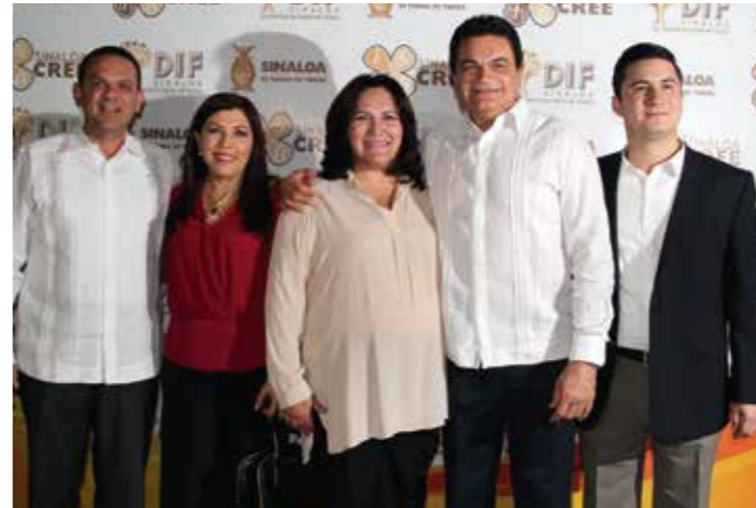
Sinaloa CREE 2014 "Por una sociedad incluyente"

Las personas con discapacidad representan un área de trabajo muy valioso dentro del Sistema para el Desarrollo Integral de la Familia, donde se trabaja intensamente para atender a este sector de la población. Por ello, se realizó la Campaña Sinaloa (CREE) "Por una sociedad incluyente", en beneficio de la mejora continua del Centro de Rehabilitación y Educación Especial CREE en Culiacán.