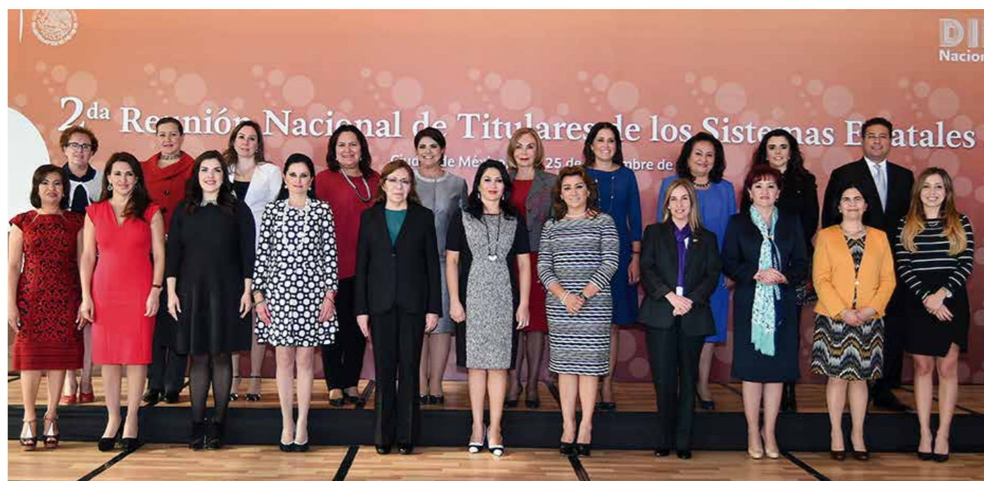
Segunda Reunión Nacional de Titulares de los Sistemas Estatales DIF 2014